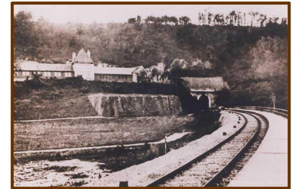
Tunnel de St Rimay 1943

afin de pouvoir diriger, au plus près et en toute sécurité, les opérations militaires sur le front de l'Atlantique, en cas de débarquement.